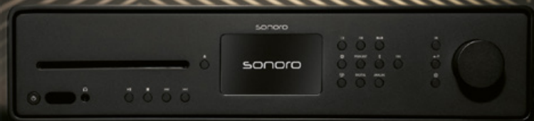
Verbesserte Klangqualität in neuem Design: sonoro launcht zwei neue smarte Audiosysteme, das „Meisterstück (Gen.2)“ (links) und den „Maestro Quantum“ (rechts).