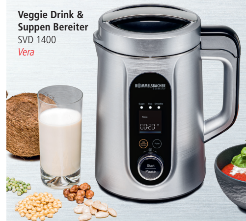
Veggie Drink & Suppen Bereiter SVD 1400 Vera