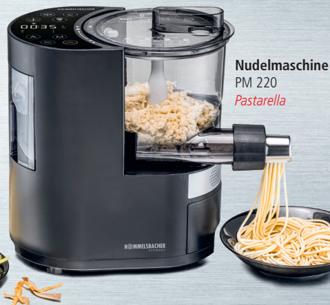
Nudelmaschine PM 220 Pastarella

Mehr Informationen auf: www.rommelsbacher.de