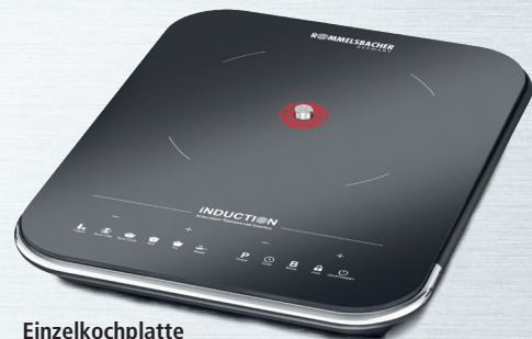
Einzelkochplatte CTS 2000/IN INDUCTION