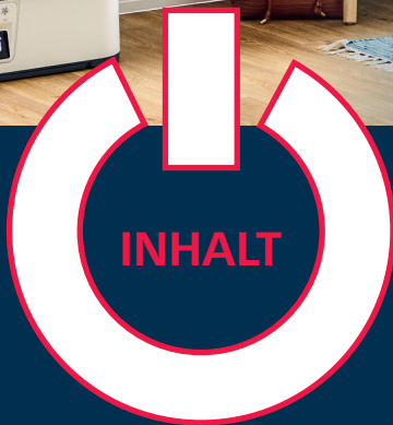
Im Fokus unserer Titelstory auf den Seiten 16 und 17 steht die Grill-Innovation von WMF, der „Urban Master Grill“.