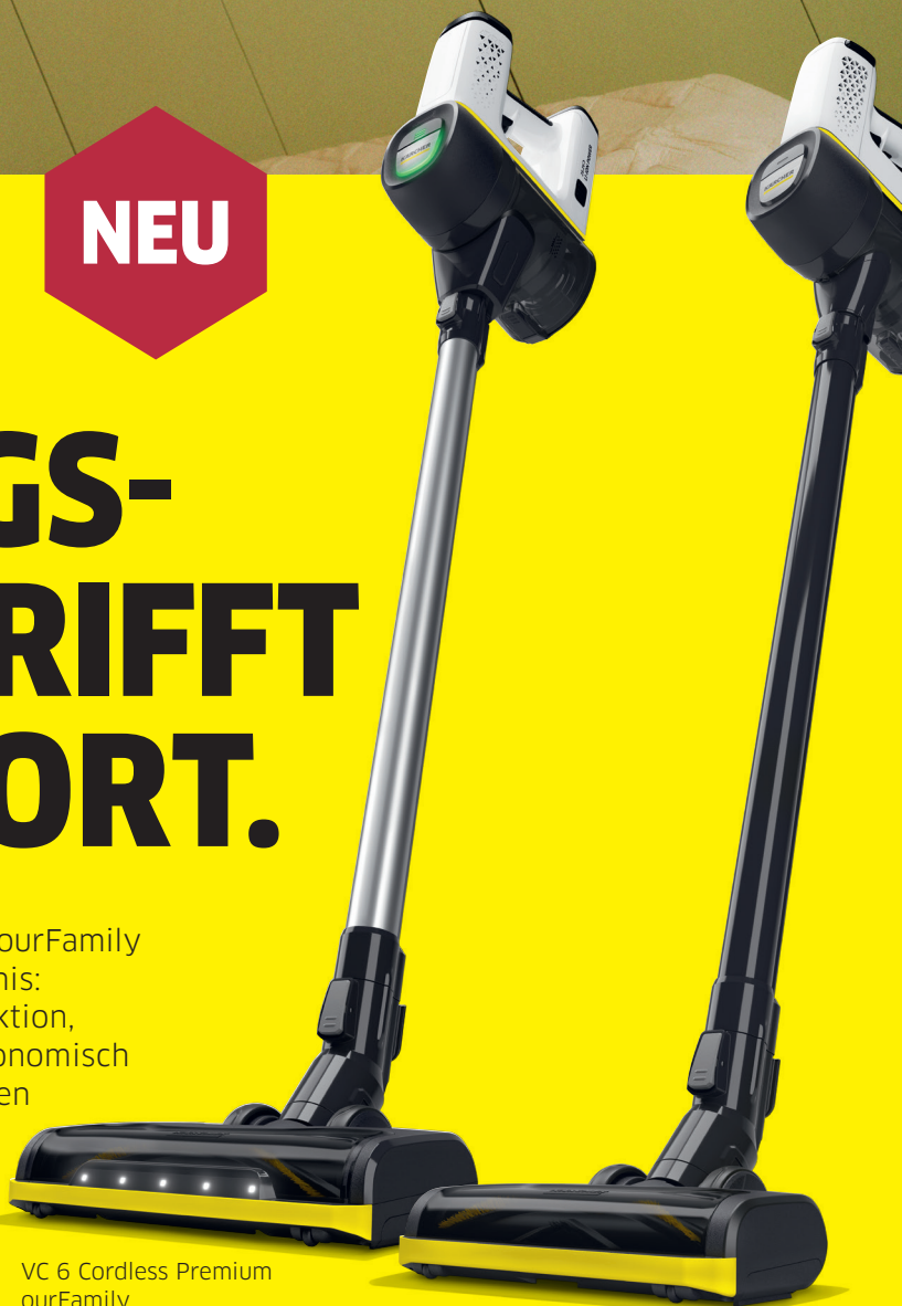
VC 6 Cordless Premium ourFamily

Mit dem Akku Staubsauger VC 6 Cordless Premium ourFamily wird das Saugen zu einem echten Reinigungserlebnis: 1-Klick-Entleerung des Staubbehälters, Boost-Funktion, Extra Power mit bis zu 100 Minuten Laufzeit, ergonomisch und leicht für die Reinigung an schwer zugänglichen Stellen sowie LED-Beleuchtung an der aktiven Bodendüse. kaercher.de